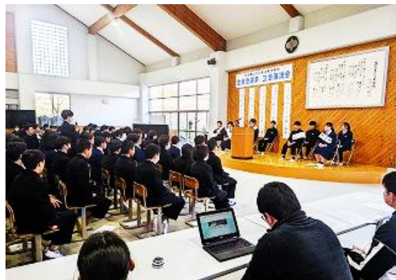
生徒会専門委員長立会演説会

3年生から受けた恩を、次は在校生が繋いで行く番です。次期生徒会のリーダーを中心に、篠山東中学校が益々発展し、盛り上がることを願っています。