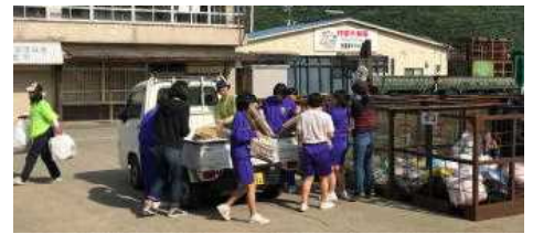
村雲地区リサイクル活動より

6月1日(土)多紀地区、城東地区で小中合同リサイクル活動を実施しました。多紀小PTAのみなさま、城東小PTAのみなさま、本校PTAのみなさま、地域のみなさま、ご協力ありがとうございました。この収益は、子どもたちの教育活動に有効に使わせていただきます。第2回リサイクル活動は11月9日(土)です。よろしく願いいたします。